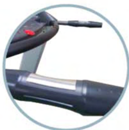
Датчики на рукоятях